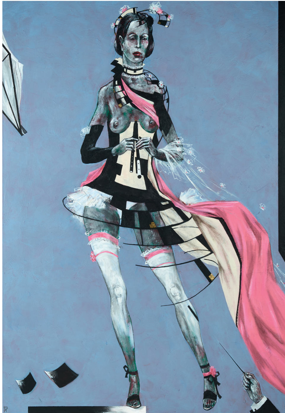
Euterpe Muse der Lyrik und des Flötenspiels