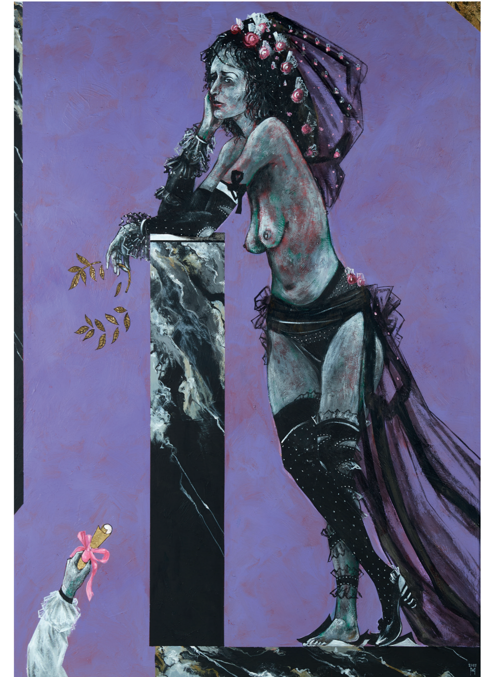
Polyhymnia Muse der Hymnendichtung