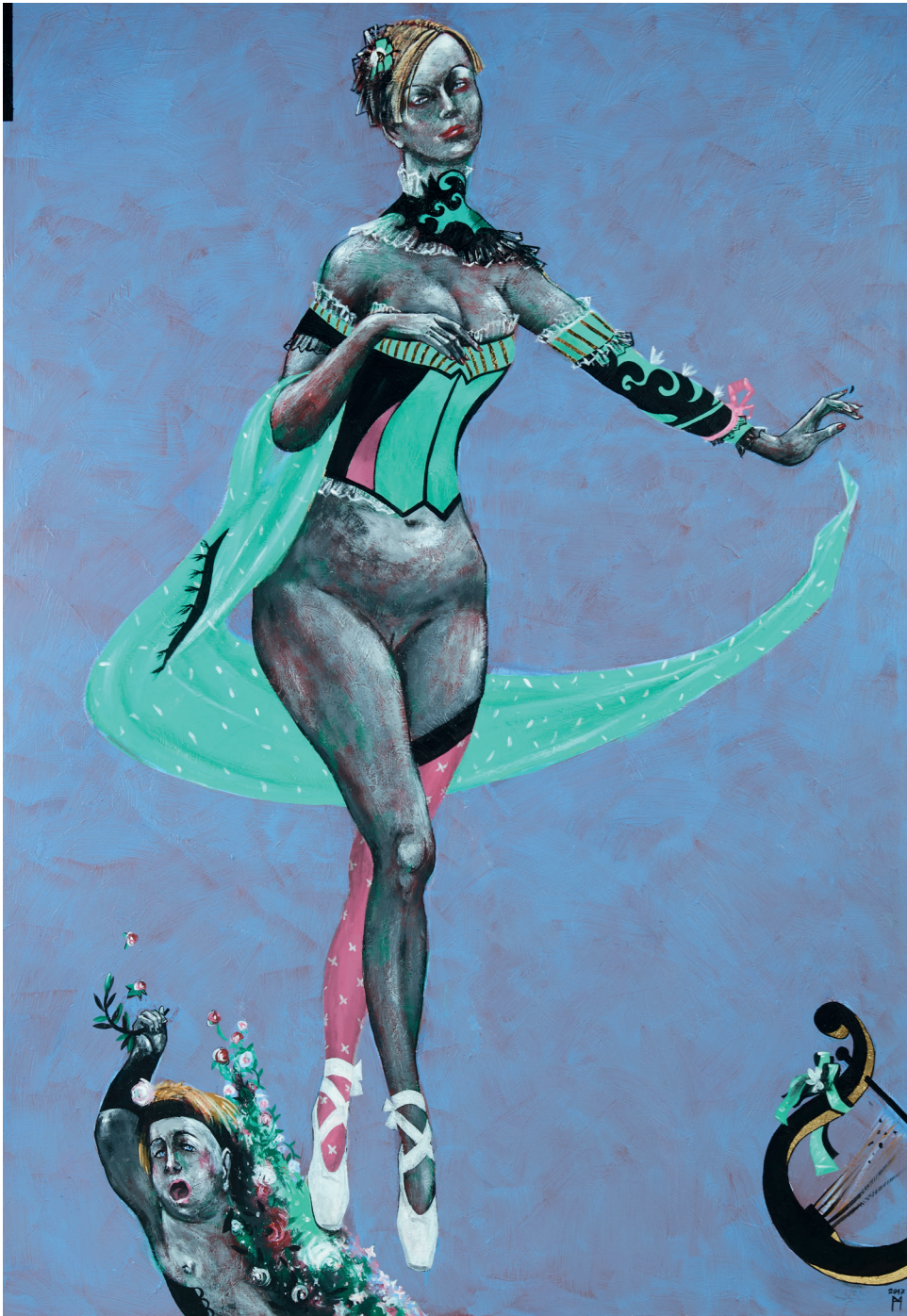
Terpsichore Muse für Chorlyrik und Tanz