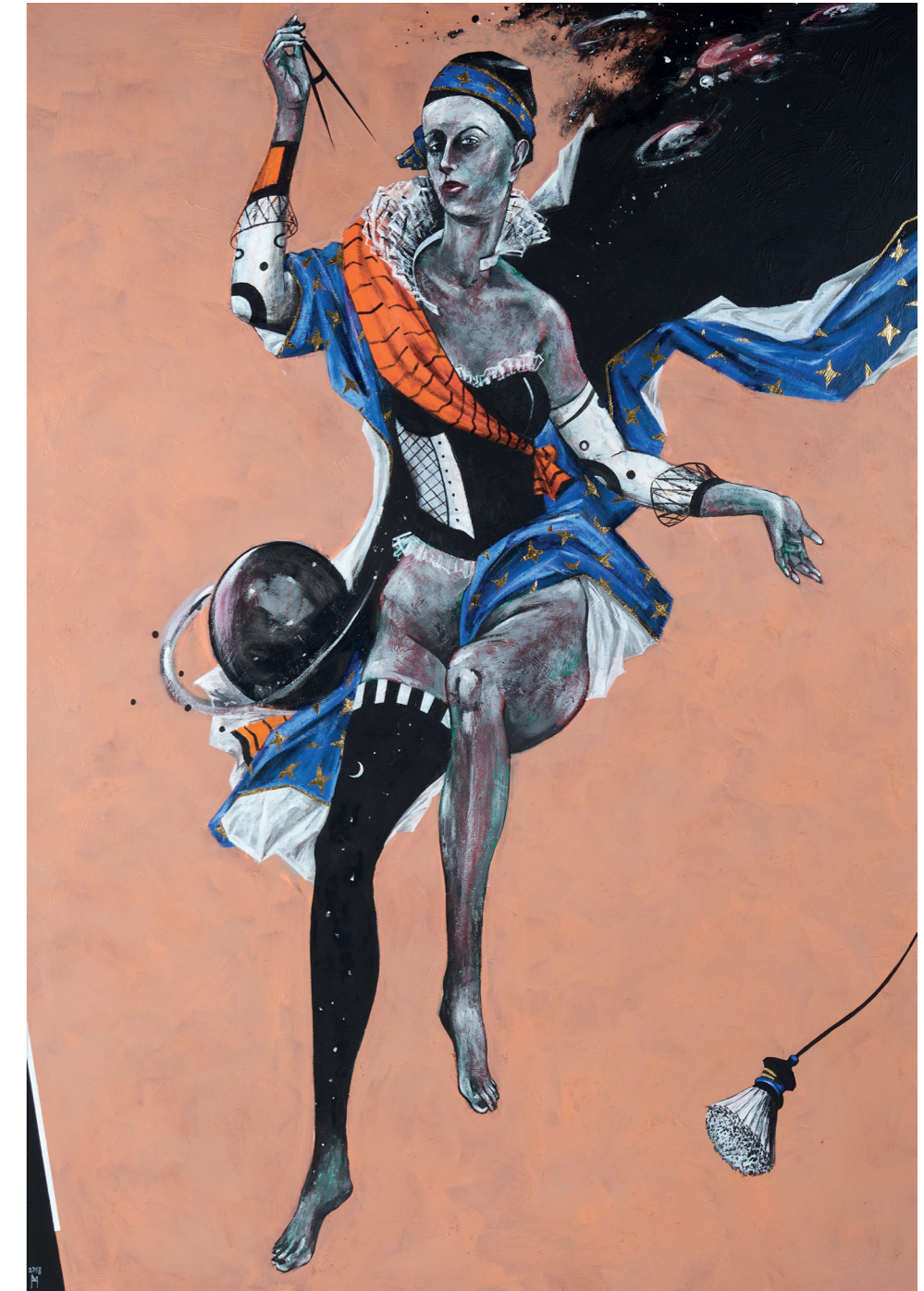
Urania Muse der Astronomie