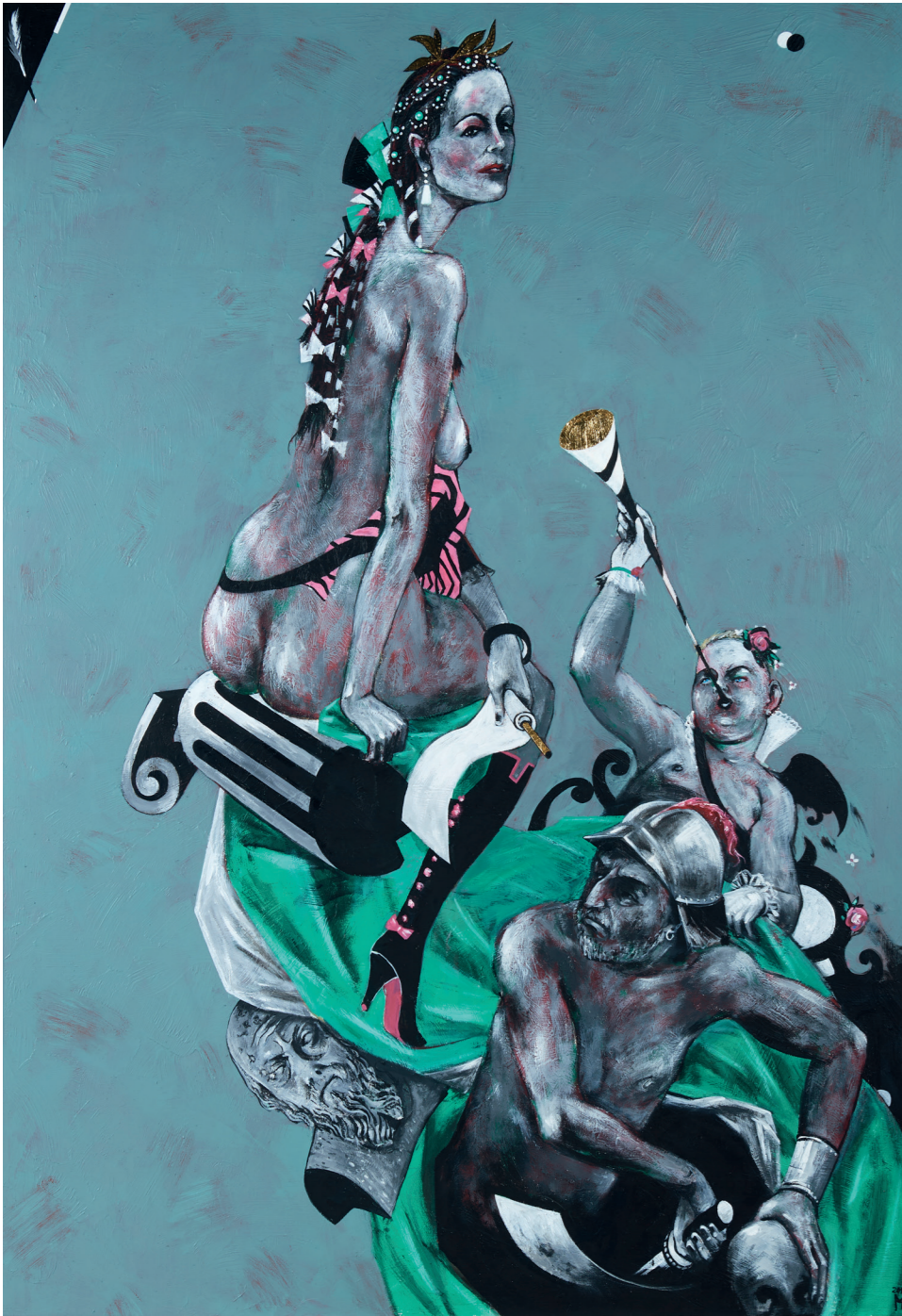
Klio Muse der Geschichtsschreibung