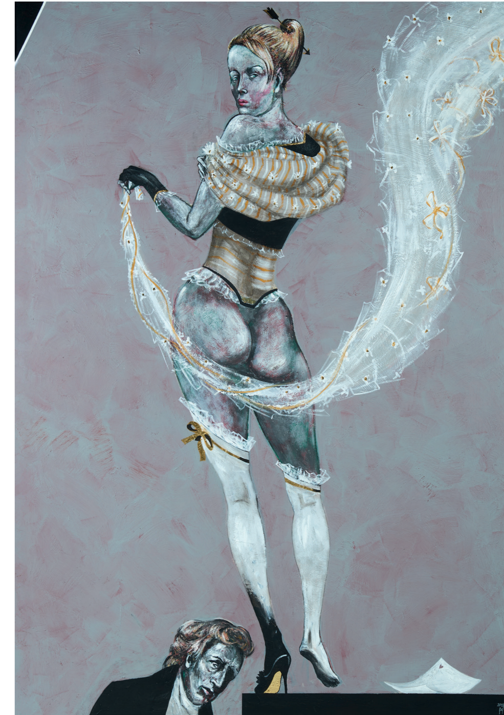
Erato Muse der Liebesdichtung