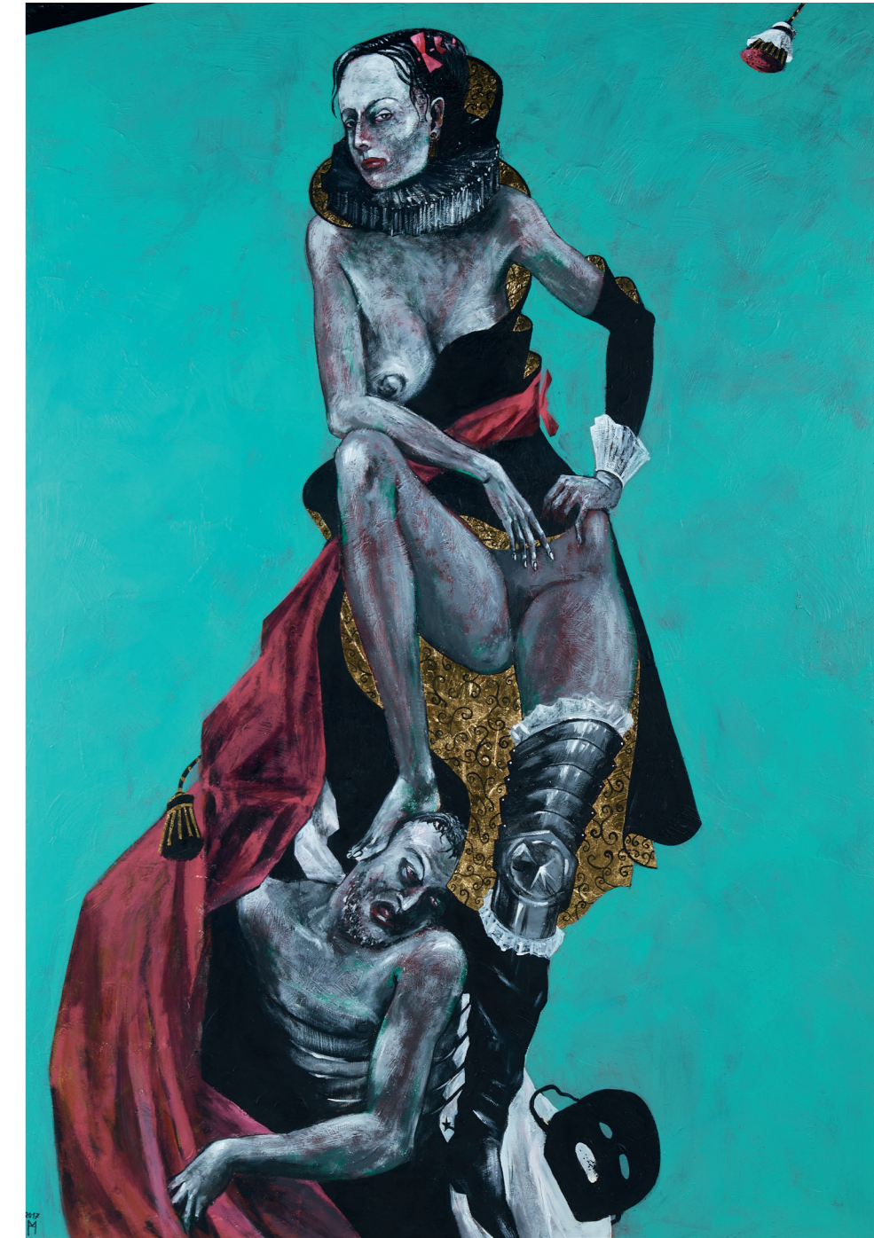
Melpomene Muse der Tragödie