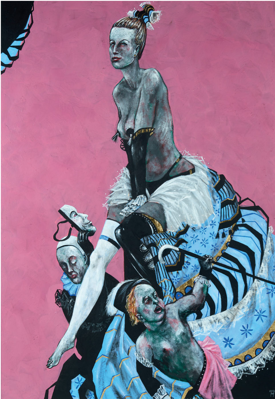
Thalia Muse der Komödie